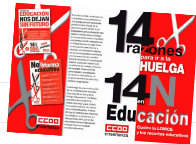
Los meses finales de 2012 y el primer trimestre de